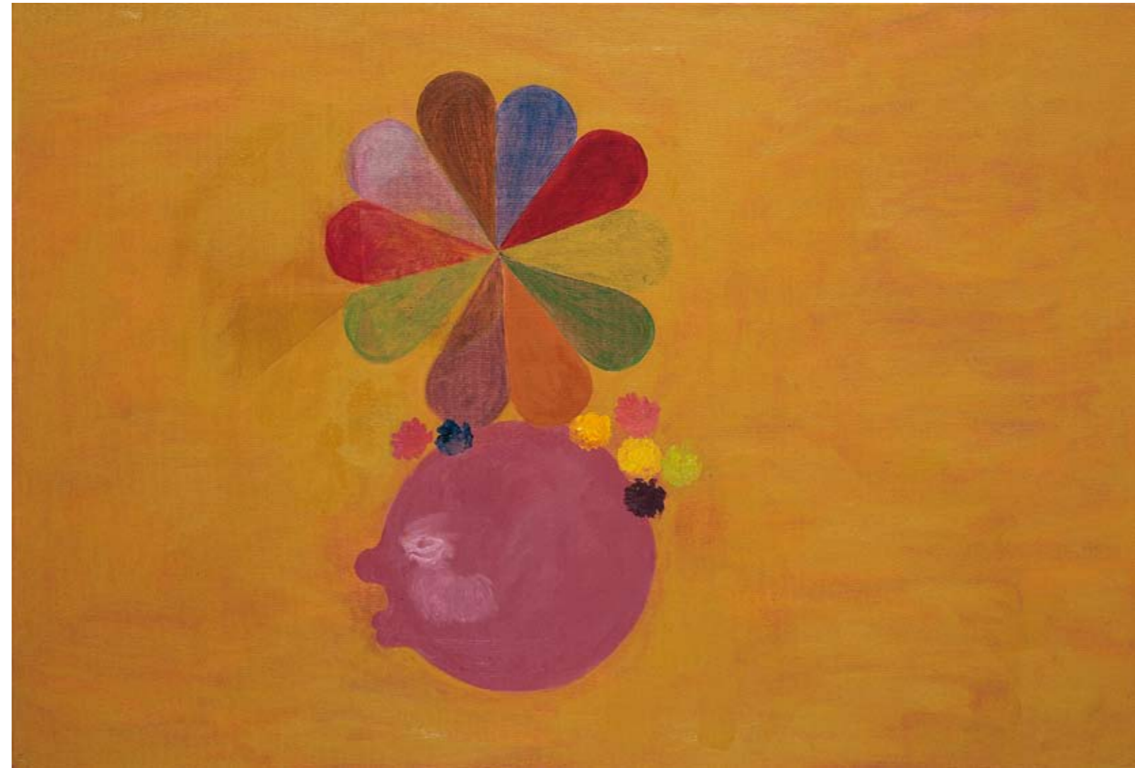
Lotta Määttä, Nakkifantasia, 2004. Ölly kankaalla 130 cm x 160 cm. Kuvaaja Jussi Tiainen.