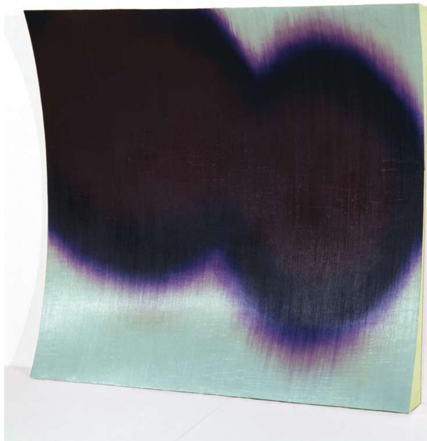
Jussi Niva, Expose # 70, 1999. Öljymaalau- s vanerilla, 115 cm x 120 cm x 14 cm. Jenny ja Antti Wihurin rahaston kokoelma, Rovaniemen taidemuseo.