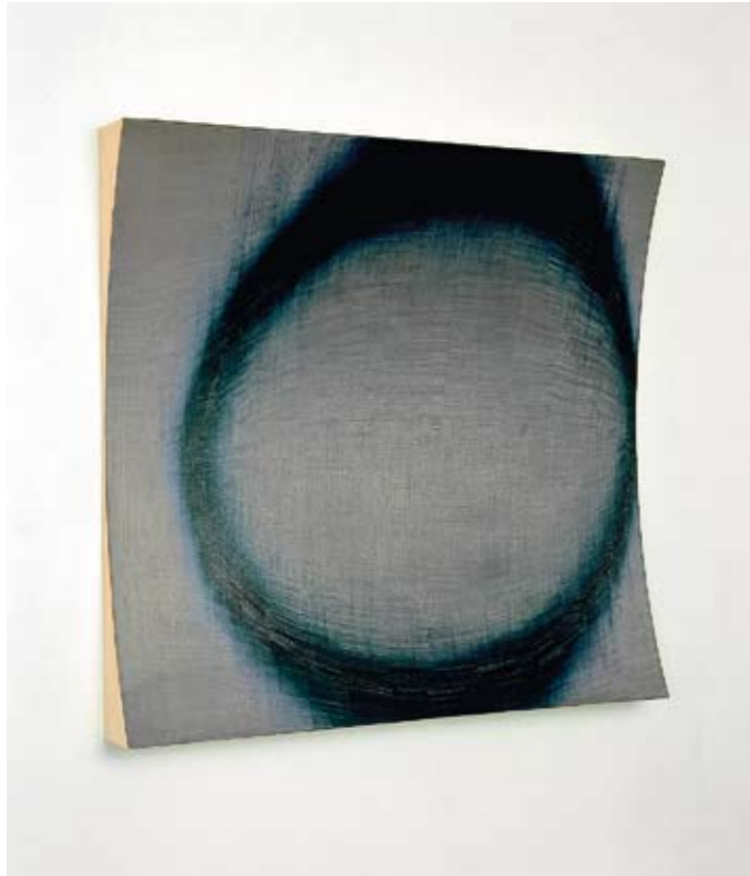
Jussi Niva, Expose # 63, 1999. Öljymaalauk vanerilla, 115 cm x 120 cm x 14 cm. Jenny ja Antti Wihurin rahaston kokoelma, Rovaniemen taidemuseo.