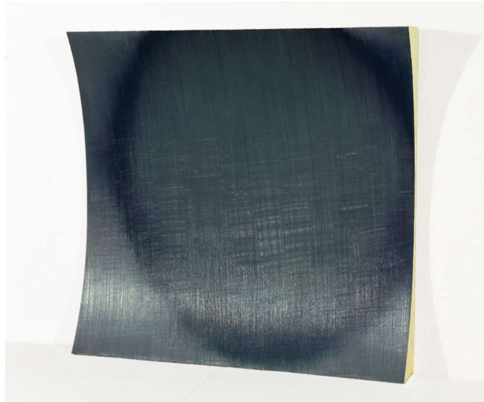
Jussi Niva, Expose # 74, 2000. Ölly puulle, 115 cm x 122 cm x 14 cm.