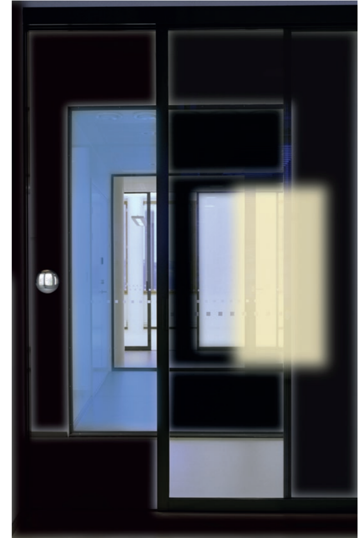
Tila (passage 5) 2007, 195 x 125 cm

Pertti Kekarainen työskentelee valokuvien parissa kuin kuvanveistäjä. Oikeassa mittakaavassa kuva on läsnä tilassa ja hetkessä.