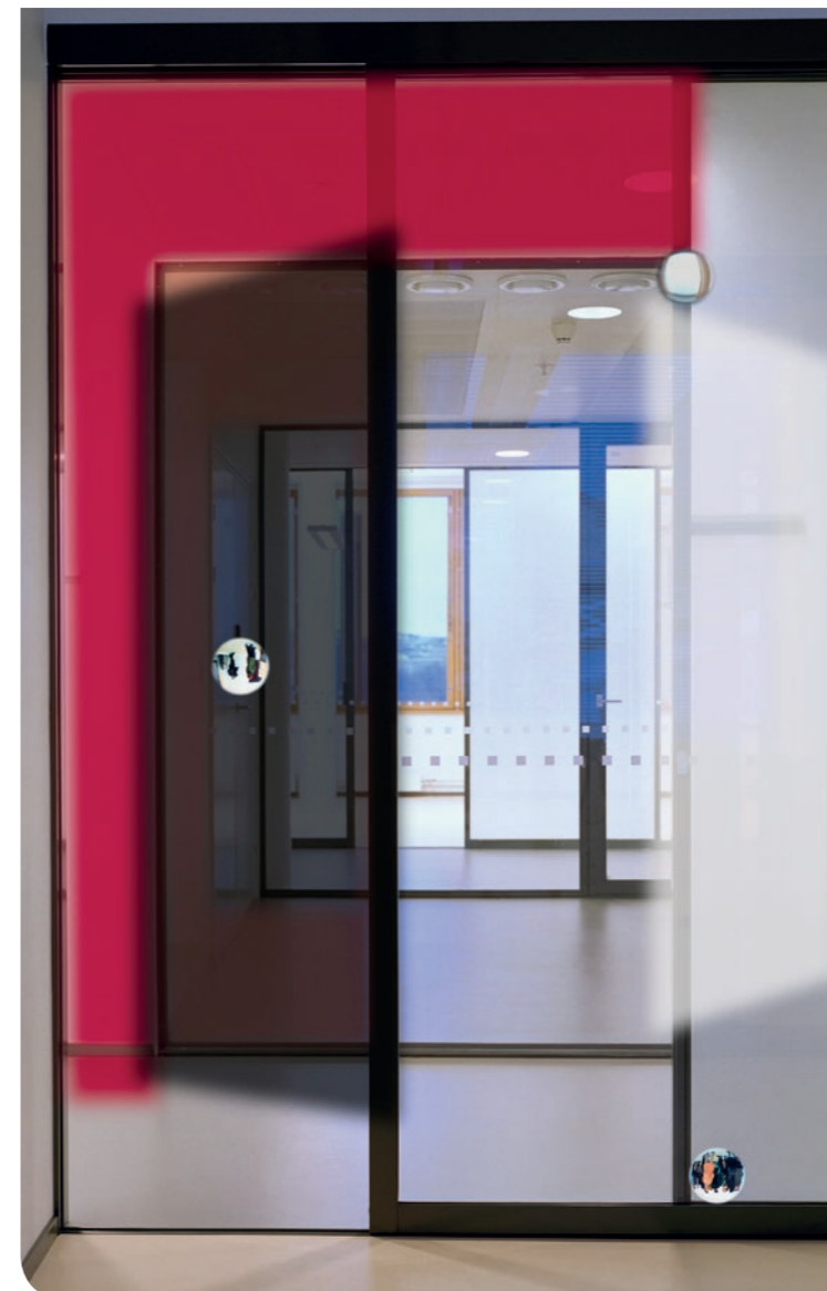
Tila (passage 7) 2007, 195 x 125 cm