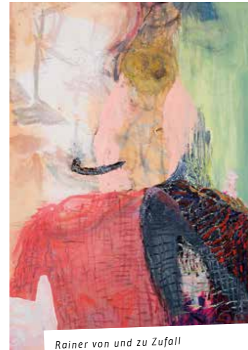
Rainer von und zu Zufall 2012, muste, akryyli ja öljy kankaalle, 87 x 116 cm

– Voi olla, luulen että olet jäljillä. Vaikka aiheeni ovat aika arkisia, niin pyrin siihen, että niissä on jotain, johon ihmiset pystyvät samaistumaan ja unohtamaan itsensä. En ole koskaan tyytyväinen omiin töihini. Joskus sitä kuitenkin huomaa yksittäisestä työstä, miksi oikeastaan ylipäättensä maalaan.