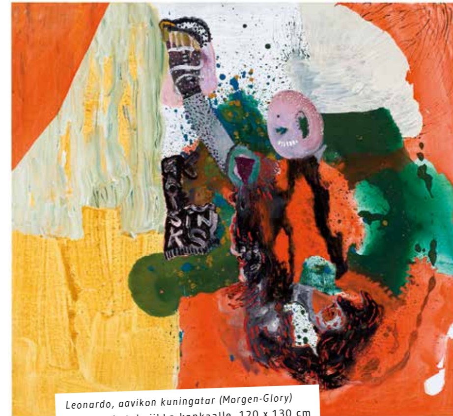
Leonardo, aavikon kuningatar (Morgen-Glory) 2009, sekatekniikka kankaalle, 120 x 130 cm