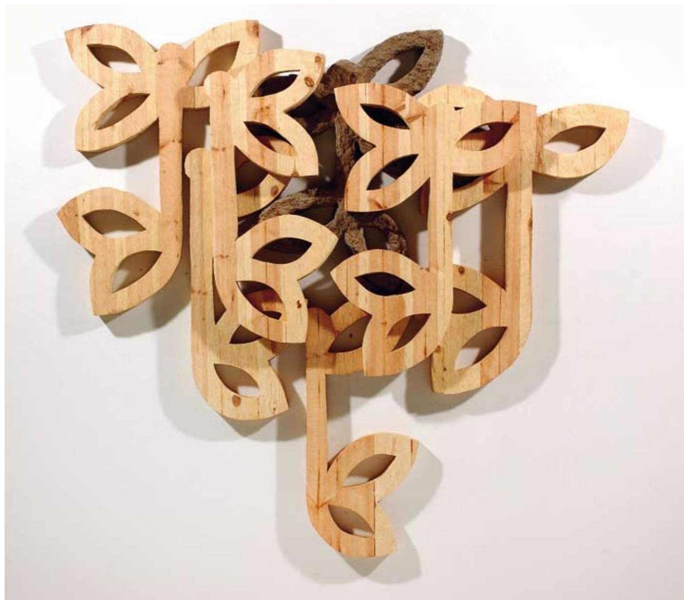
Lauri Rankka, Parveilua, 2001. Puu/betoni. Oulunsalon kunta.